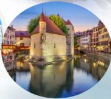
Annecy & Chamonix