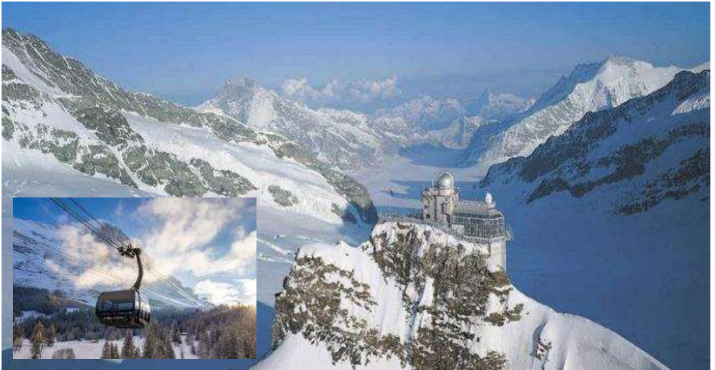
ป้าย นำท่านเดินทางลงเขาด้วยรถไฟ ฟันเฟืองสู่สถานีไอเกอร์ (Eigergletscher) จากนั้นโดยสารกระเช้าชมวิว เทือกเขาแอลป์ (The Eiger Glescher) ลงสู่สถานีเทอร์มินัล กรินเดลวาลด์ ซึ่งใช้เวลาเพียง 12 นาทีเท่านั้น