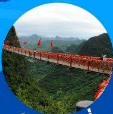
ภูเขาหลุย่