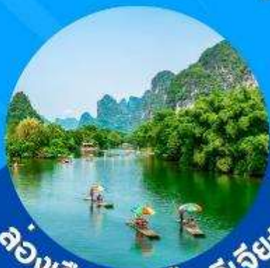
ล่องเรือในแม่น้ำหลี่เจียง