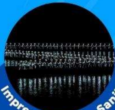
Impression of Liu Sanjie